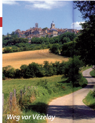
Weg vor Vézelay