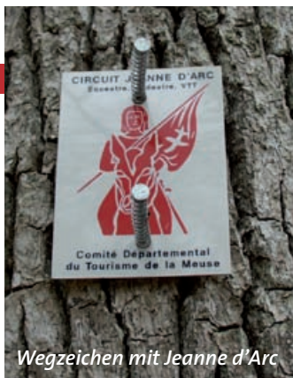
Wegzeichen mit Jeanne d'Arc

Dieser Weg ist heute als „sentier de Jeanne d'Arc“ gestaltet. Historisch bevorzugten die PilgerInnen des