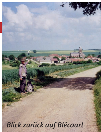
Blick zurück auf Blécourt