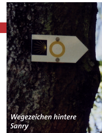
Wegezeichen hintere Sanry