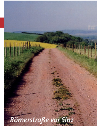
Römerstraße vor Sinsz

Mittelalters von Toul den Weg über Neufchâteau, Chaumont und Abbaye Fontenay, aber heute nach Vorarbeit der Düsseldorfer Jakobusbruderschaft (siehe die Ausgaben der „Kalebassen“ Nr. 35 und 37) hat sich dieser etwas nördlichere Weg über die Abbaye de Clairvaux und Auxerre angeboten und ist von den PilgerInnen bereits angenommen. Der Pilger wird in der Regel (ca 80 %) auf dem Wegenetz der französischen Fernwanderwege des FFRP (nationaler französischer Wanderverband) geleitet, bzw. auf regionalen gezeichneten Wanderwegen und, wo nicht vermeid-